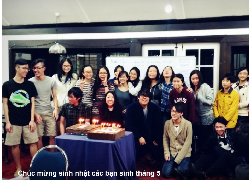
Chúc mừng sinh nhật các bạn sinh tháng 5