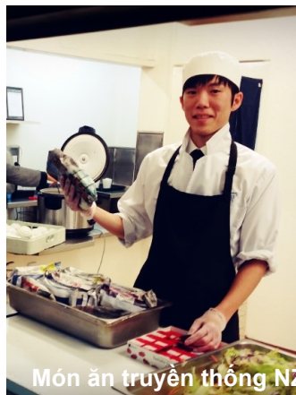
Món ăn truyền thống NZ