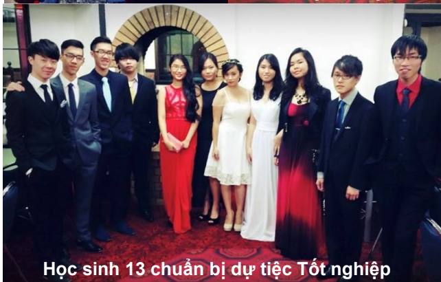
Học sinh 13 chuẩn bị dự tiệc Tốt nghiệp