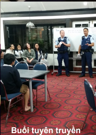
Buổi tuyên truyền