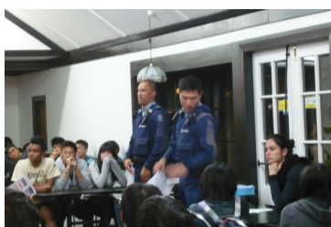
Buổi thuyết trình của lực lượng Công an