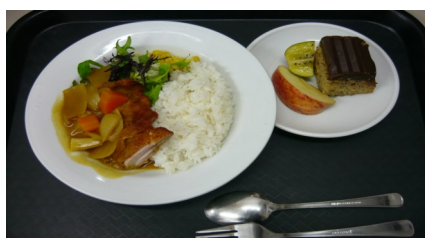
21 Tháng 8: Cà ri và bánh tráng miệng!