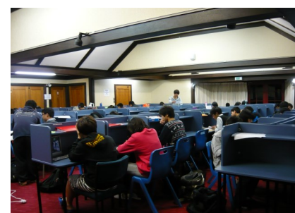
7:00-10:00 tối: trong phòng học chung