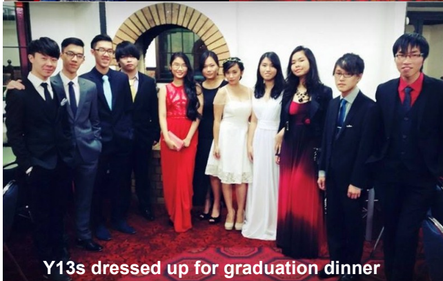
Y13s dressed up for graduation dinner