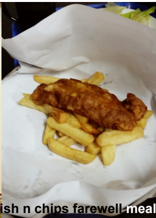
Catering staff prepare fish n chips farewell meal