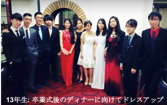
13年生: 卒業式後のディナーに向けてドレスアップ